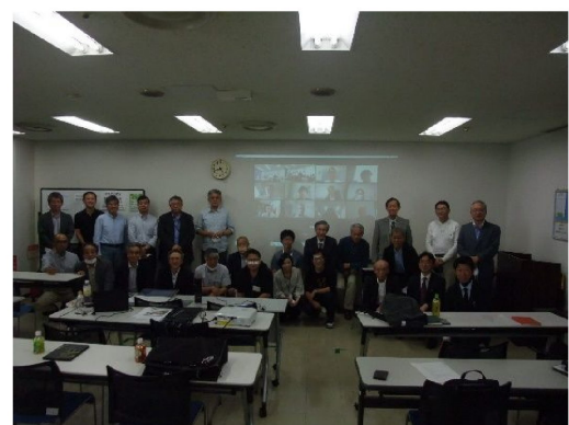
写真-8 懇談会 WEB参加者 集合写真