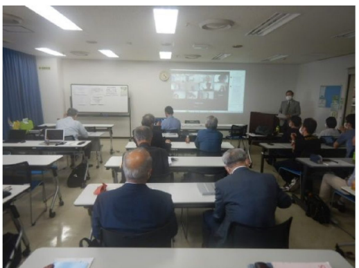
写真-7 講演会・懇談会 参加者